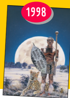
Pierdomenico Baccalario La strada del guerriero