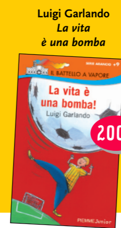
Luigi Garlando La vita è una bomba