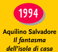
Aquilino Salvatore Il fantasma dell'isola di casa